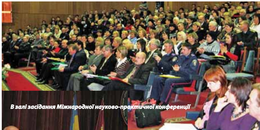
В залі засідання Міжнародної науково-практичної конференції

зиції Запорізької обласної державної адміністрації та Запорізької обласної ради. Адже цей напрямок роботи визначено одним із пріоритетних. В області з метою розробки нормативно-правового механізму взаємодії суб'єктів створено координаційну раду з питань патріотичного виховання молоді при голові Запорізької обласної ради;