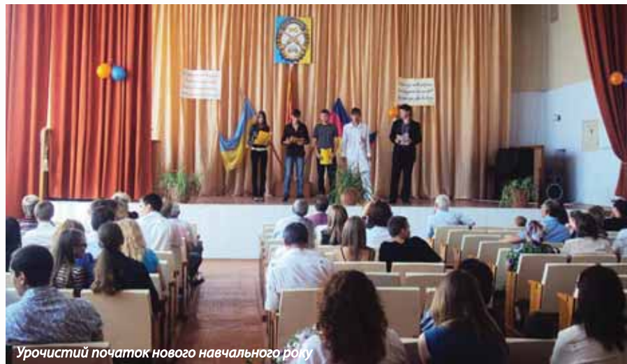
Урочистий початок нового навчального року

— Про цей коледж я дізнався від свого старшого товариша, який закінчив його, — розповідає студент 2-го курсу В.