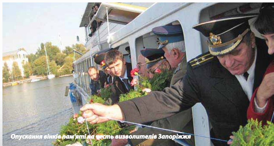
Опускання вінків пам'яті на честь визволителів Запоріжжя