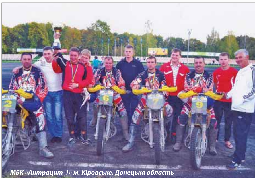
МБК «Антрацит-1» м. Кіровське, Донецька область

Хоча Кубок Василя Коростеля у результаті видовищної боротьби повезли додому білоруси, атмосфера дружби, взаємопорозуміння, піднесеного настрою об'єднала всіх учасників, а ще додала оптимізму й віри у відродження славних традицій українського мотоболу і залишила незабутні враження у глядачів.