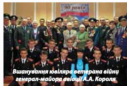
Вшанування ювіляра ветерана війни генерал-майора авіації А.А. Короля

прийнята та функціонує Обласна програма патріотичного виховання молоді на 2012–2016 роки; затверджена обласна програма з увіковічення пам'яті захисників Вітчизни, які загинули в роки Великої Вітчизняної війни, «Згадаймо всіх поіменно» на 2010–2015 роки; затверджена та реалізується Запорізька обласна концепція патріотичного виховання громадян.