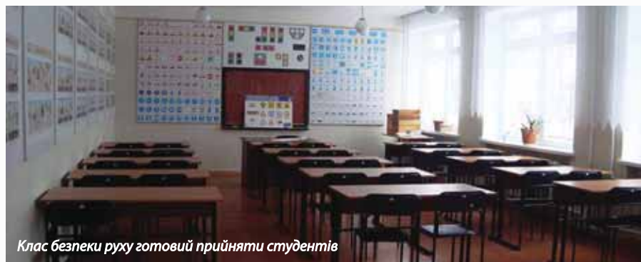
Клас безпеки руху готовий прийняти студентів